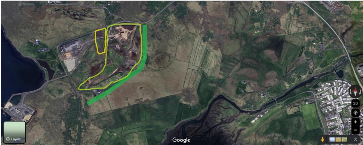
Mynd 1 - Dökkgrænt er skógræktarsvæði. Ljósgrænt er svæði til að byggja upp útivistarsvæði. Gult er ný rein til að urða.

Gróf yfirlitsmynd yfir framtíðarnýtingu Álfsness: