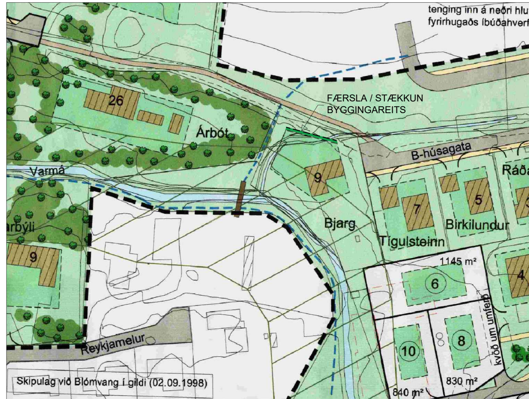
Auglýst í B-deild Stjórnartíðinda 7.4.2004