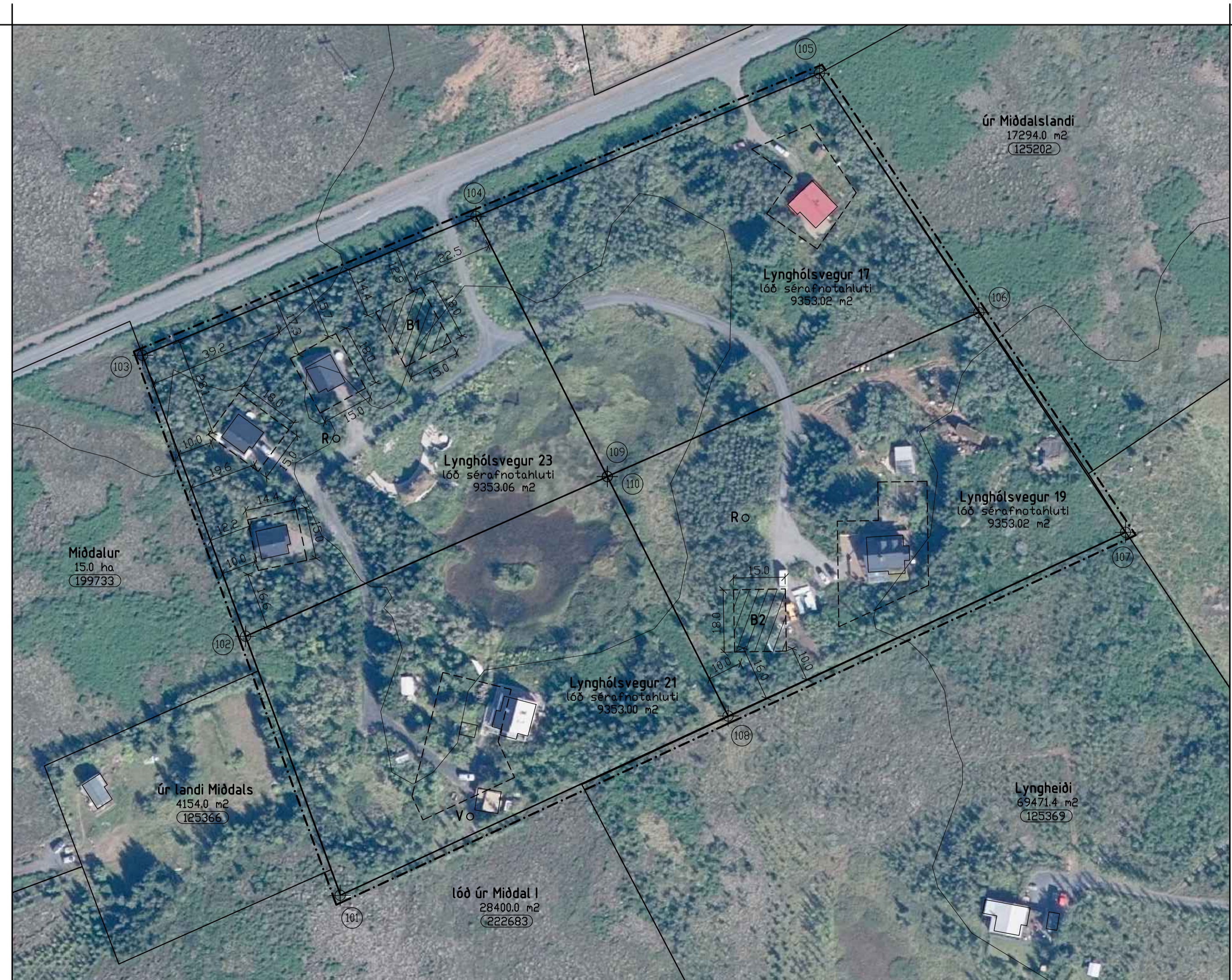
TILLAGA AÐ BREYTINGU Á DEILISKIPULAGI