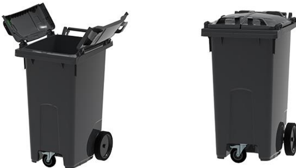
Mynd 2 – tvískipt ílát

Litur sorpíláta við fjöleignarhús mun til að byrja með taka mið af þeim ílátum sem fyrir eru og nýtingu á ílátum sem fjarlægð verða við sérbýli. Mikilvægt er að nýta þau ílát sem fyrir eru til að lágmarka stofnkostnað. Starfshópurinn leggur til að við kaup á nýjum ílátum fyrir fjöleignarhús verði notuð lituð ílát til að tryggja sem besta flokkun. Eftirfarandi mynd sýnir sorpílát í sorpgeymslu fjöleignarhúss í Möldal í Svíþjóð.