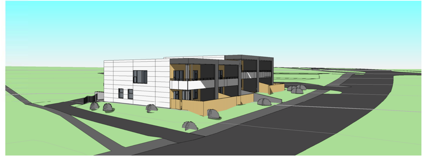
Horft frá vestri