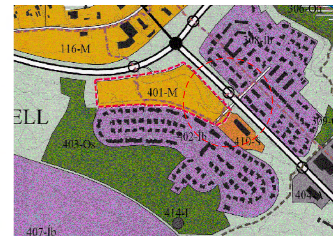
Aðalskipulag Mosfellsbæjar 2011-2030