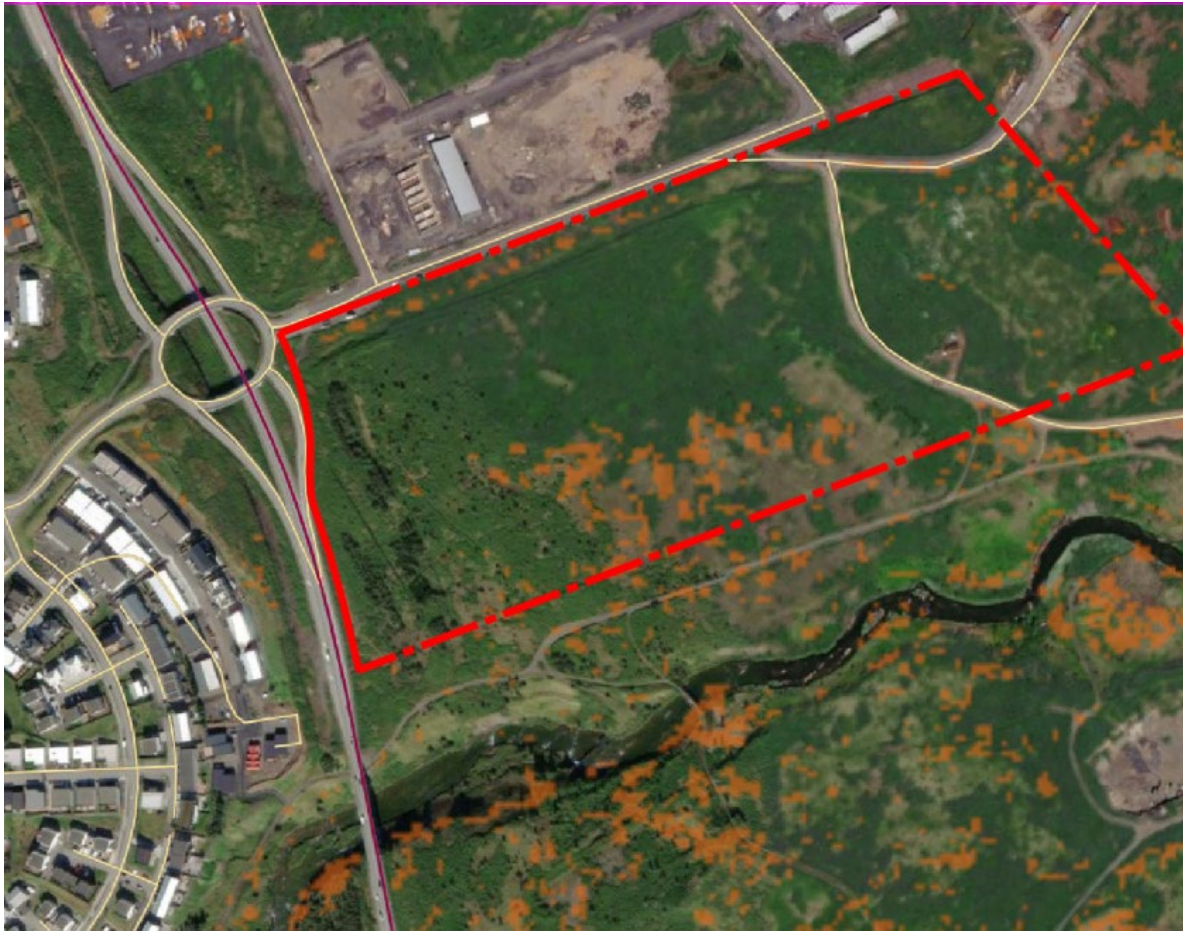
Mynd 3 Skjáskot af vefsjá alta/ mýrlendi. Unnið úr vistgerðaflokkun Náttúrufræðistofnunar Ekkert votlendi sem nýtur verndar er á svæðinu en á hluta svæðisins er mýrlendi.

Jarðfræði – Berggrunnur á svæðinu er basískt og ísúrt gosberg og setlög frá fyrri hluta ísaldar.