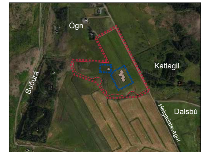
Afstöðu-/ skýringamynd í mkv. 1:10000 (map.is/moso)