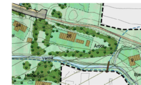
ÚRDRÁTTUR ÚR DEILISKIPULAGI

Spurt er hvort leyft yrði að byggja vinnustofu austan við baðhúsið, allt að 80m 2 . Lóðarhlutinn þar nýtist ekkert eins og er. Hann er umkringdur háum trjám og sést hvergi að. Húseigendur eru bæði listamenn og starfa við hönnun; arkitekt og lækniþræðilegur teiknari, og vantar aðstöðu. Húsið yrði mjög einfalt; opinn skáli með einum skolvaski. Stórir gluggar til suðurs og ofanljós í þaki. Samkvæmt deiliskipulagi er þetta utan byggingarreitar en staðhættir eru miklu hentugri en að byggja framan við núverandi hús sem er eitt af best hönnuðu húsum Mosfellsbæjar og mikil staðarþrýði við Varmá.