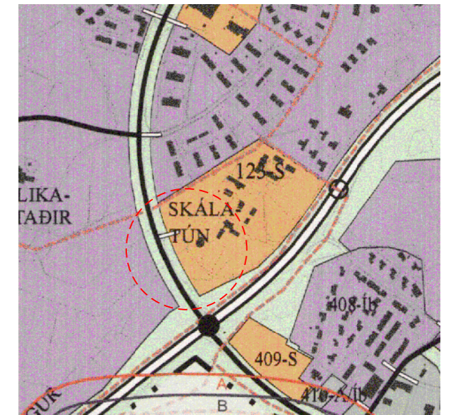
Aðalskipulag Mosfellsbæjar 2011-2030