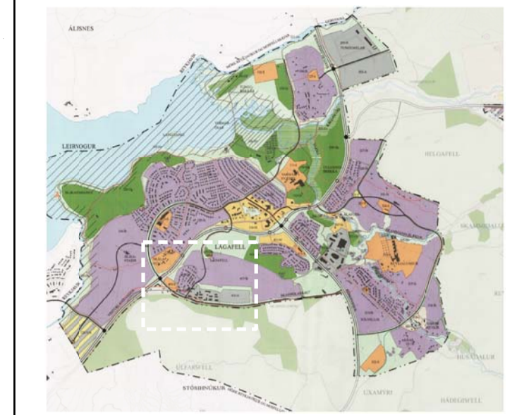
Aðalskipulag Mosfellsbæjar 2011 - 2030