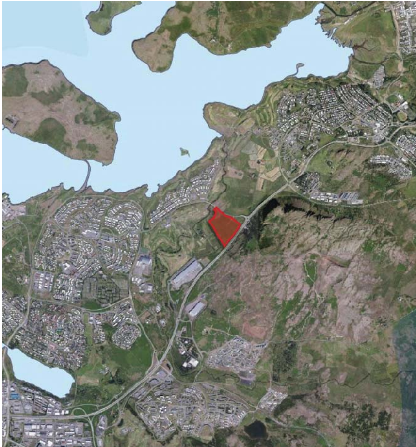
Mynd 1: Staðsetning skipulagssvæðis