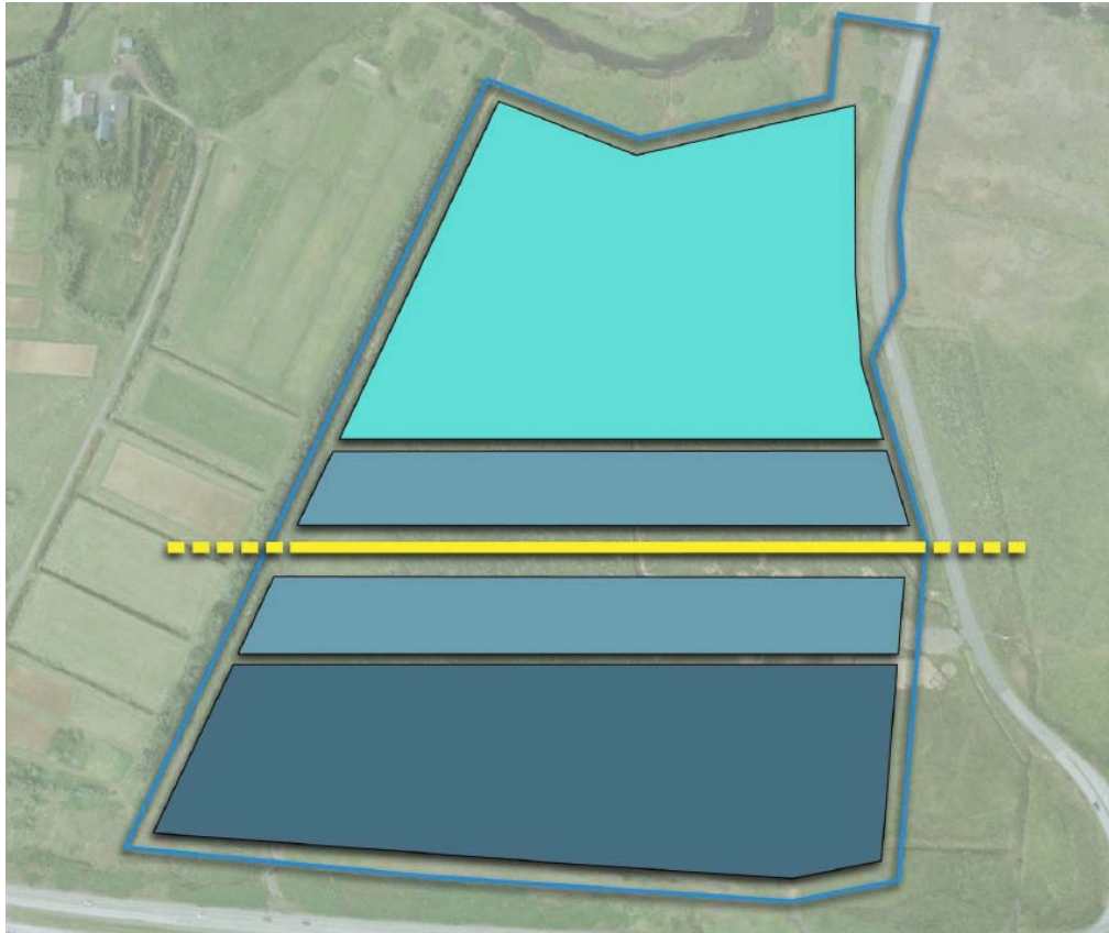
Mynd 3: Skýringamynd úr þróunaráætlun – skipting innan svæðis