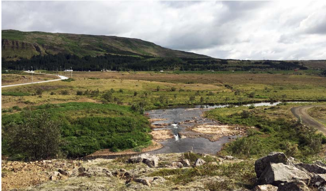
Mynd 4: Horft yfir skipulagssvæði úr vestri

Á skipulagssvæðinu sjálfu eru framræst tún og er svæðið nokkuð gróið. Svæðið liggur að Úlfarsá en lóðarmörk lands Reita eru 50 metra frá miðjum árfarveginum. Lax er í ánni, lífríki og gróðurfar meðfram henni er auðugt og fuglalíf er fjölbreytt.