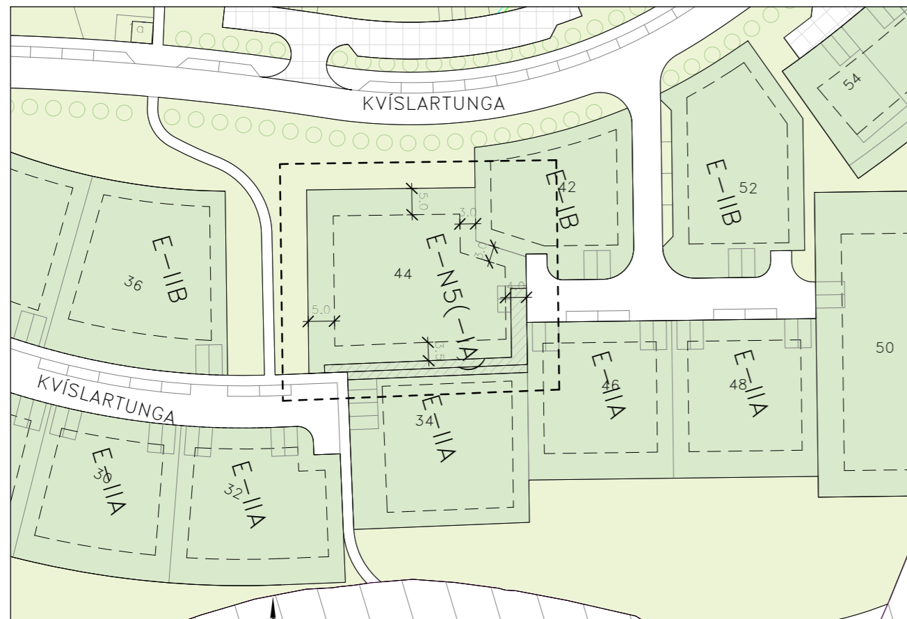
Gildandi deiliskipulag samþykkt í bæjarstjórn Mosfellsbæjar 28.3.2007