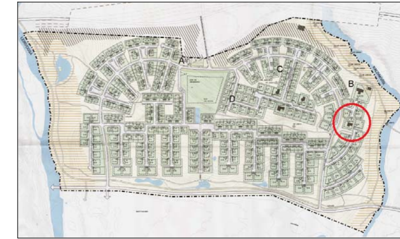
Deiliskipulag Lerivogstungu (ekki í kvarða)