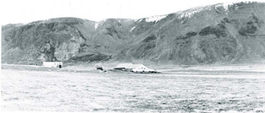
mynd 5 – bæjarhóllinn, vélaskemma t.v og útihús t.h, Ingólfsfjall í baksýn 4 .