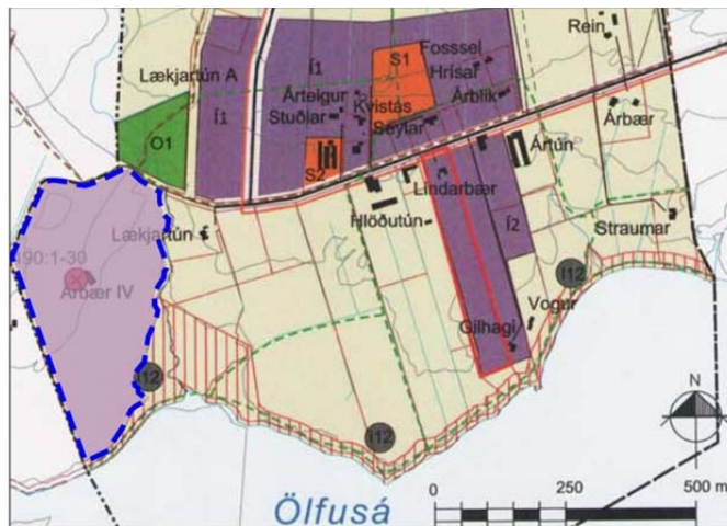
Úr aðalskipulagi Ölfus 2010-2022 þekja innan blábrottinnar línu sýnir íbúðasvæði sem óskað er eftir.

Í kafla 5.4.4 í aðalskipulagi segir að byggð í Árbæjarhverfi muni tengjast núverandi veitukerfum sem fyrir eru. Í aðalskipulagi er gert ráð fyrir sameiginlegri fráveitu fyrir byggð í Árbæjarhverfi og að hreinsivirki verði staðsett á þremur stöðum syðst í byggðinni. Þau eru öll merk I12 og sýnd meðfram norðurbakka Ölfusár.