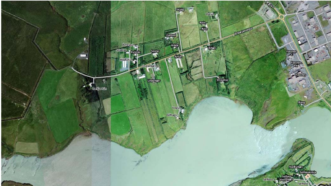
mynd 2. Yfirlitsmynd yfir íbúabyggð í Árbæjarhverfi

Í framhaldi þessa samþykkti skipulagsfulltrúi Ölfuss að unnin yrði skipulagslýsing fyrir aðalskipulagsbreytinguna sem færi til Skipulagsstofnunar, lögboðinna aðila og til íbúa auk þess að lýsingin fyrir aðalskipulagið yrði það ítarleg að hún næði einnig til fyrirhugaðs deiliskipulags. Skipulagslýsing þessi er því unnin skv. 1. mgr. 30. gr. og 1. mgr. 40. gr. Skipulagslaga nr. 123/2010. Í lýsingunni eru dregnar fram helstu forsendur og markmið aðal- og deiliskipulagsins.