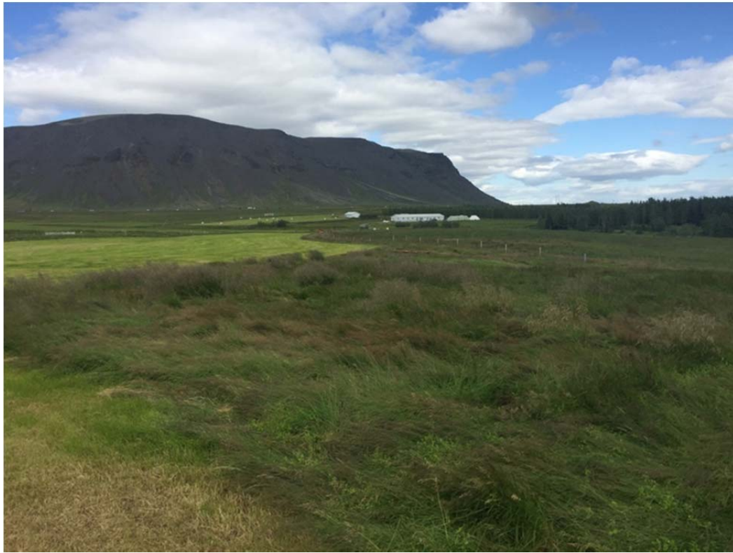
mynd 7. Horft frá bæjarhól Árbæ IV til norðausturs í átt að Ingjólfsfjalli.