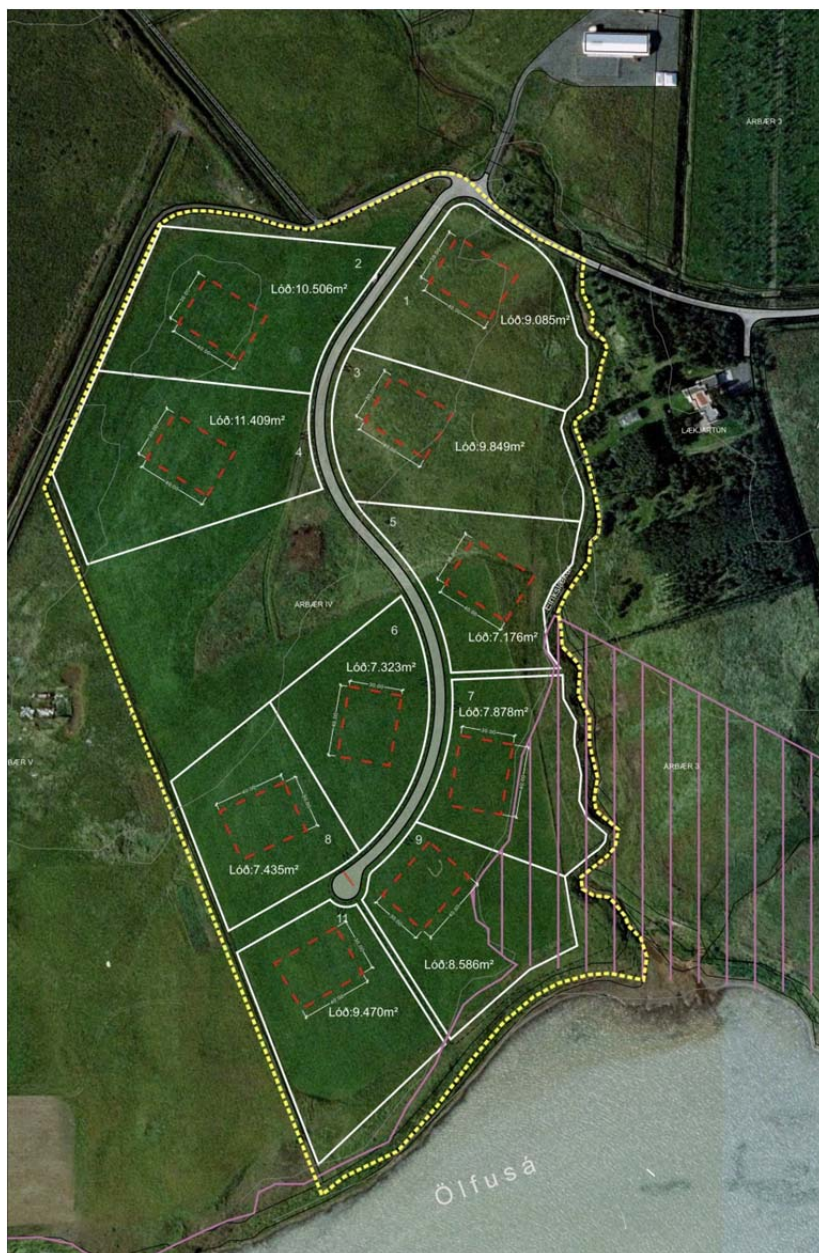
mynd 1. Yfirlitsmynd yfir fyrirhugaða íbúabyggð í Árbæjarhverfi – skipulagsdrög er sýna lóðir, lóðarstærðir byggingareiti og aðkomuveg.