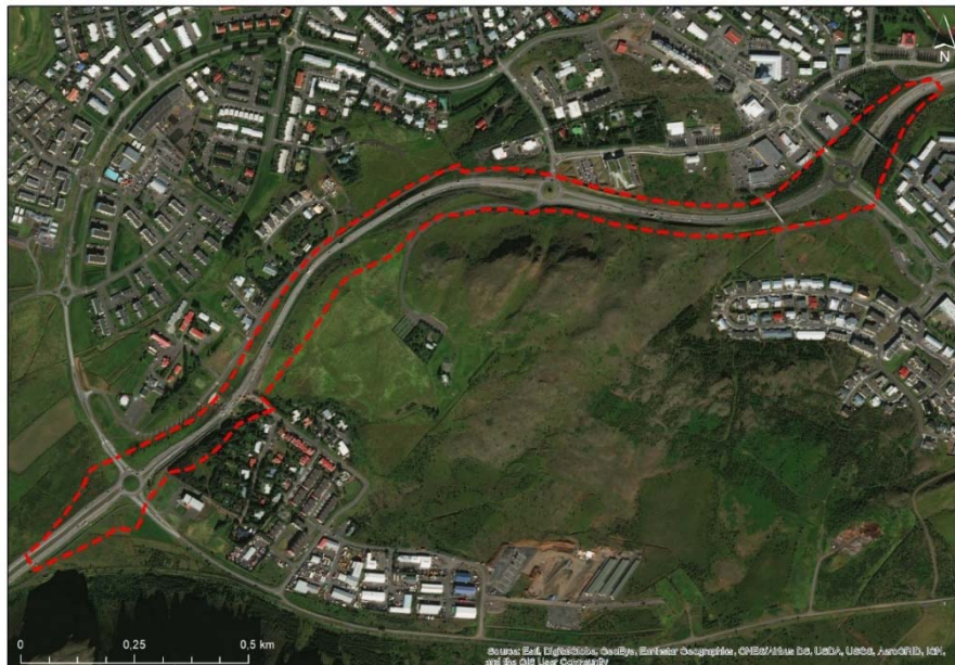
Mynd 3.1 Fyrirhugað deiliskipulagssvæði á loftmynd

Um er að ræða nýtt deiliskipulag. Gert er ráð fyrir að skipulagssvæði taki til veghelgunarsvæðis Vesturlandsvegur; mögulegrar afmörkunar mislægra gatnamóta; og göngu-, hjóla- og reiðstíga við Vesturlandsveg, eins og Mynd 3.1 sýnir. Gert er ráð fyrir að afmörkun skipulagssvæðis geti breyst í skipulagsvinnunni.