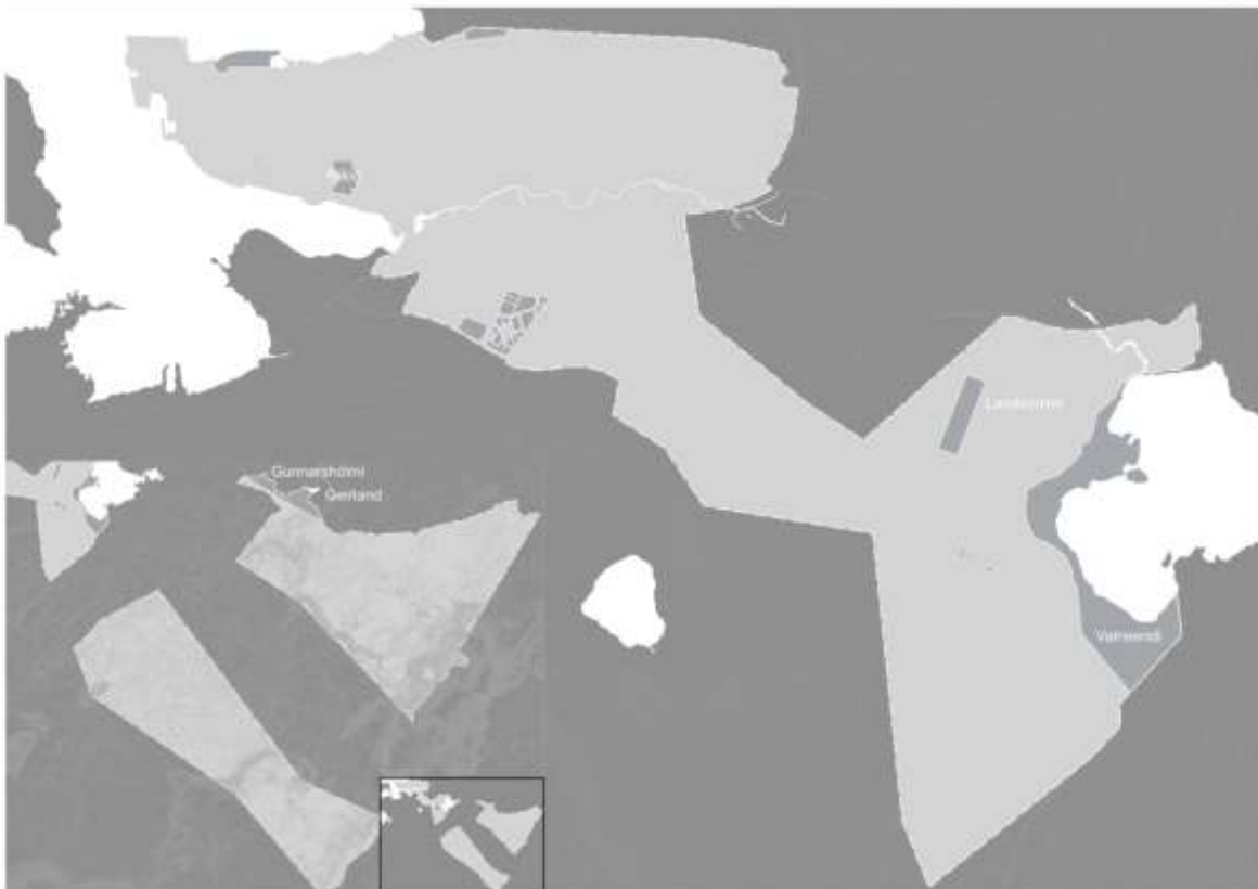
Mynd 2-1. Myndin sýnir lögsögumörk Kópavogs eins og þau eru skilgreind í gildandi Aðalskipulagi Kópavogs 2012-2024.

Austan Heiðmerkur eru tvö aðskilin svæði sem tilheyra lögsögu Kópavogs. Syðra svæðið 2,960 ha að flatarmáli nær frá Heiðmörk að mörkum Ölfuss í Árnessýslu. Nyrðra svæðið 3,380 ha nær frá Hólmsá við Gunnarshólma yfir Lækjabotna og Sandskeið suður undir Rauðuhnjúka í Bláfjöllum og af Vífilsfelli norður á móts við Lyklafell.