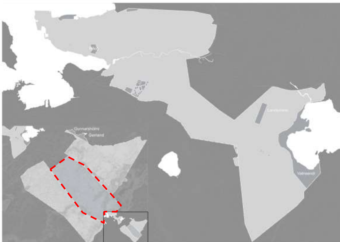
Mynd 4-2. Þjóðlendlínur innan lögsögumarka Kópavogs og breytt sveitarfélagamörk. Land innan rauðu brotalínunnar verður nú skilgreint innan lögsögumarka Kópavogs.