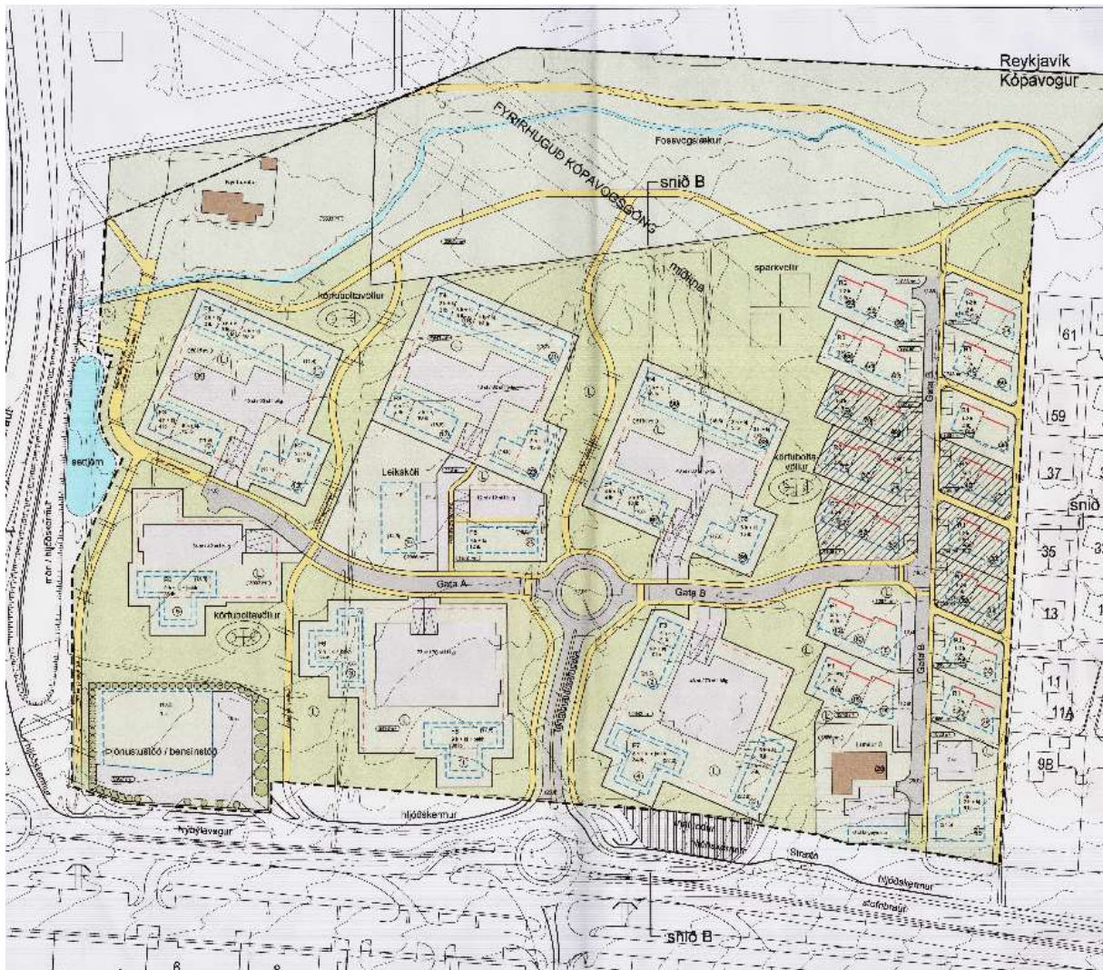
Mynd 3-2. Skipulagsuppráttur af deiliskipulagi Lunda sem sýnir fyrirhuguð Kópavogsgöng.

Breytingartillagan kallar á breytingu á deiliskipulagi Lunda sem samþykkt var 14.12.2004 en þar eru göngin sýnd á skipulagsupprætti.