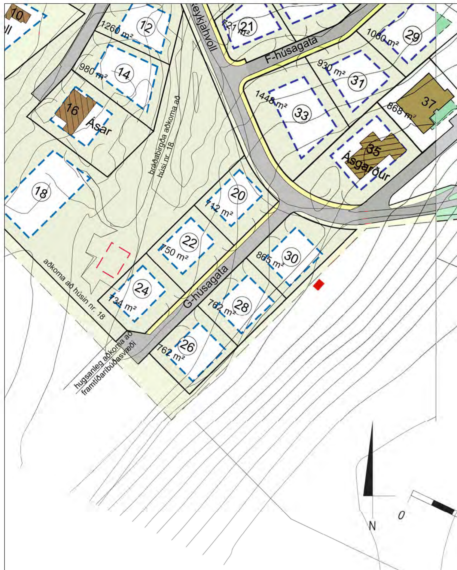
GILDANDI DEILISKIPULAG, HLUTI M. 1 : 1.000 Samþykkt í bæjarstjórn Mosfellsbæjar 21. janúar 2004, síðast breytt 6. nóvember 2012