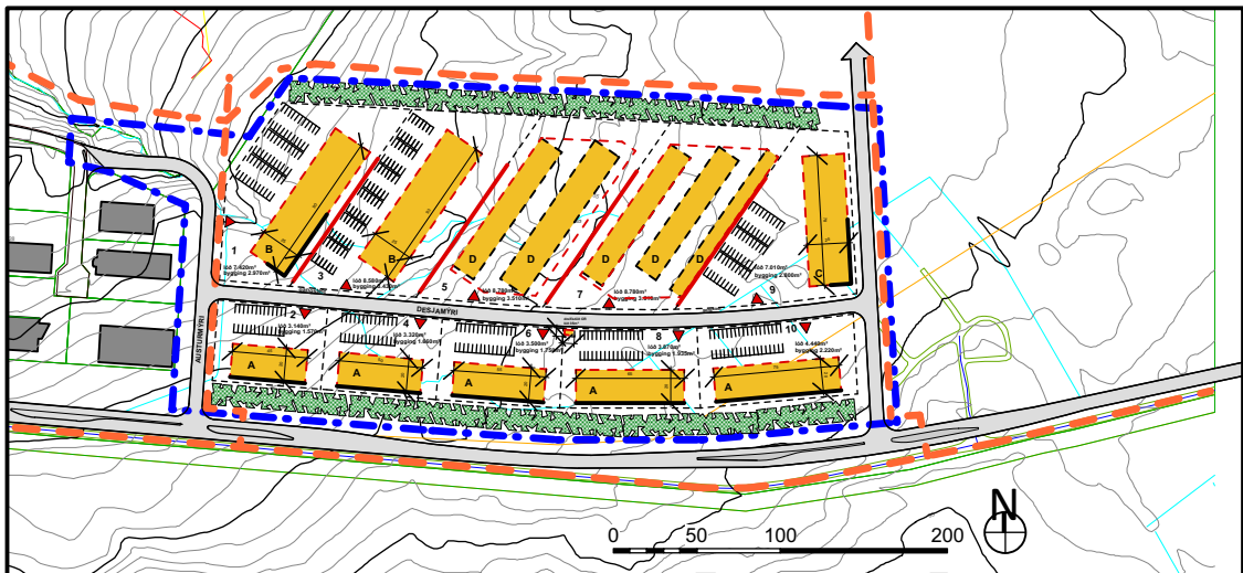
GILDANDI DEILISKIPULAG, 1:5000