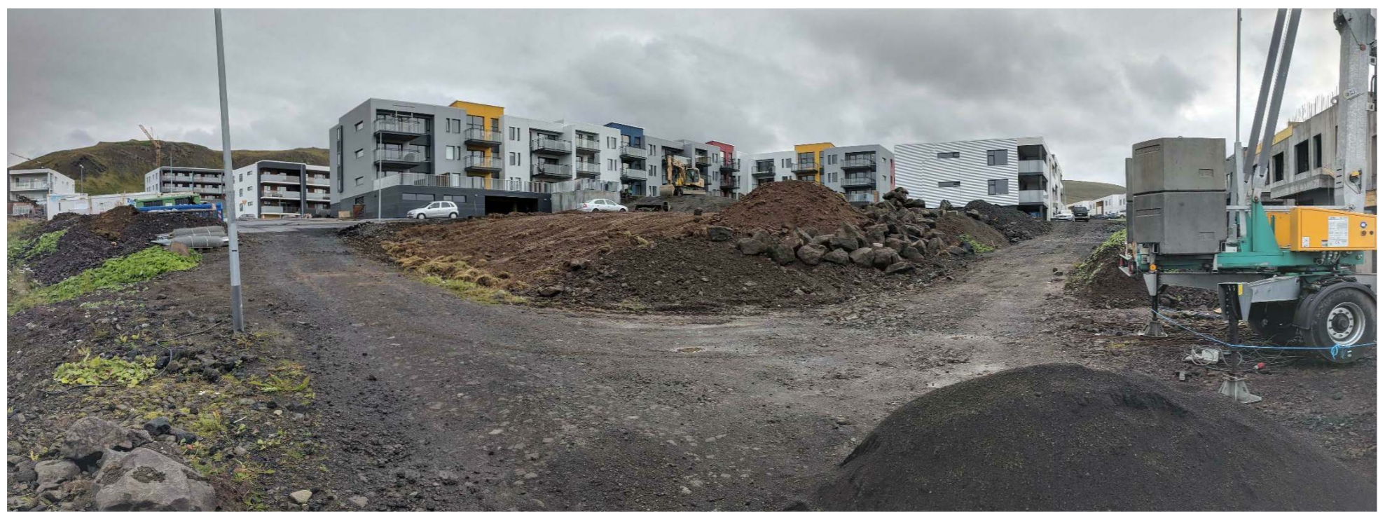
Horft í austur frá punkti 1