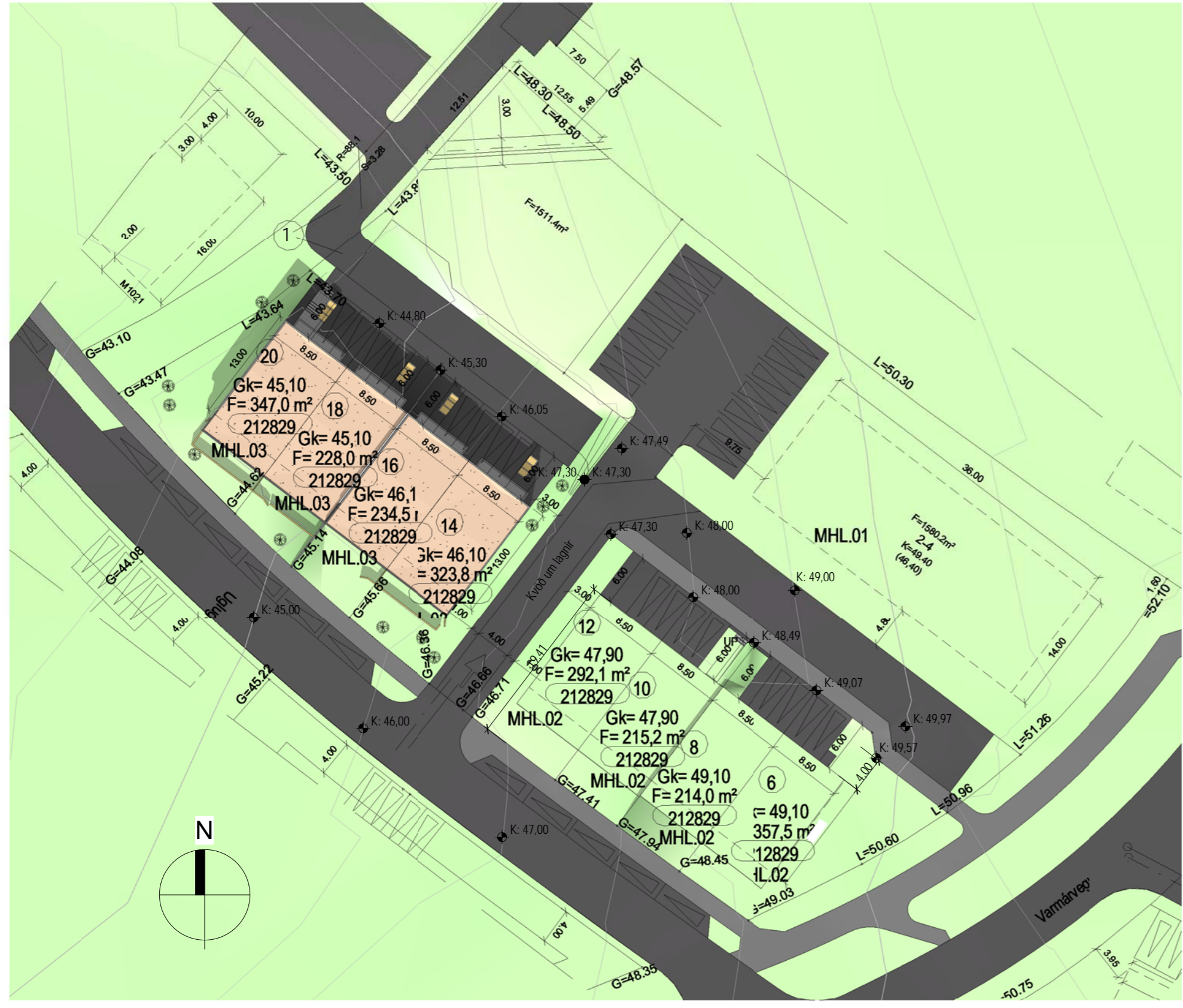
Afstöðumynd. 1 : 500