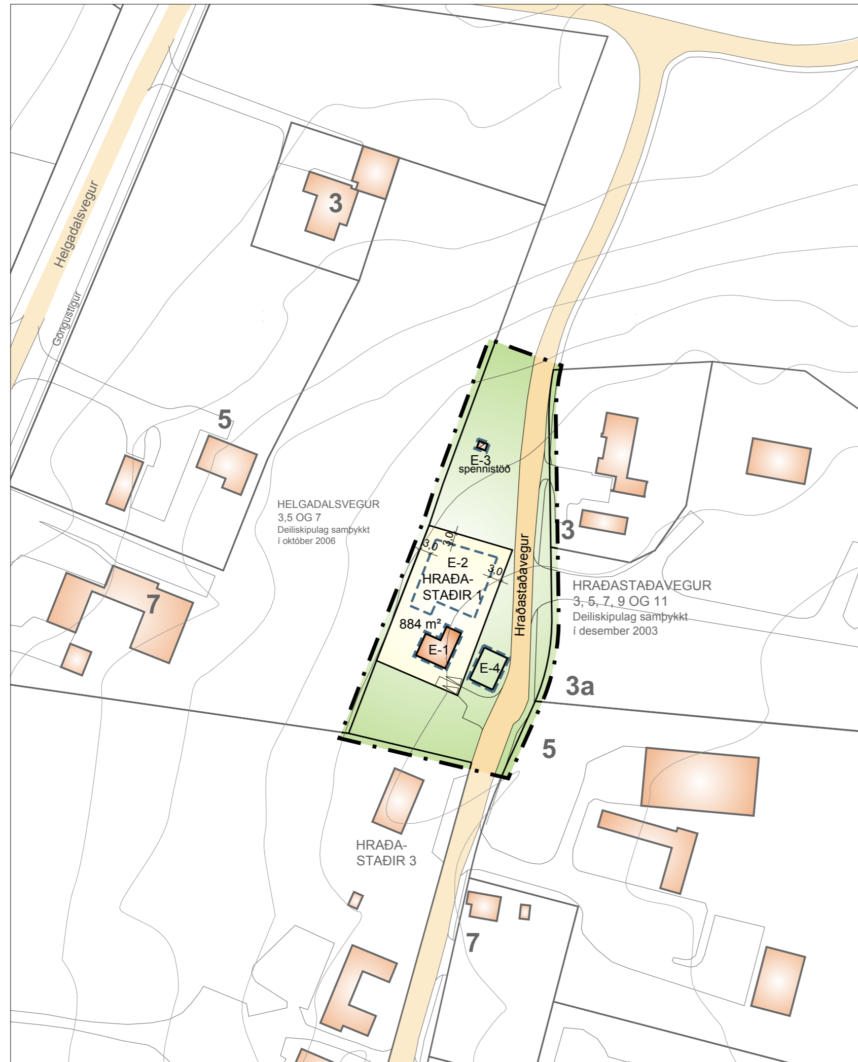
DEILISKIPULAGSUPDRATTUR, MKV. 1:1000 TILLAGA